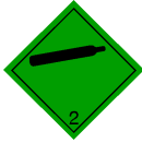
Gefahrzettel 2.2 : Nicht brennbares, nicht giftiges Gas.